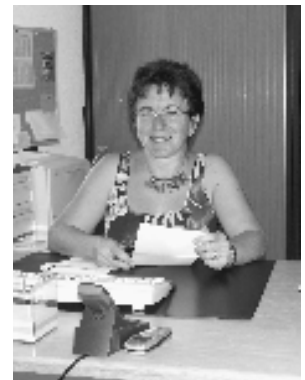
Directrice IEBC Suisse romande