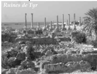
Ruines de Tyr

Une étude diligente de la Bible, dirigée par le Saint-Esprit, avec une sage (et non idéologique ou naïve) utilisation de disciplines telles que l'archéologie, ne peut qu'enrichir la compréhension du monde et du merveilleux message biblique.